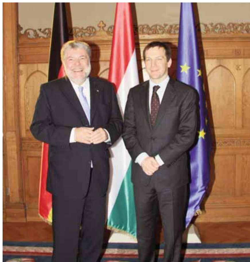
Bei seinem Besuch in Budapest wurde Ministerpräsident Kurt Beck vom ungarischen Premierminister Gordon Bajnai empfangen.

Die Exporte der rheinland-pfälzischen Wirtschaft umfassen rund 404 Millionen Euro (letzte Statistik, Januar bis Oktober 2009). Die Importe aus Ungarn nach Rheinland-Pfalz betragen in diesem Zeitraum 266 Millionen Euro.