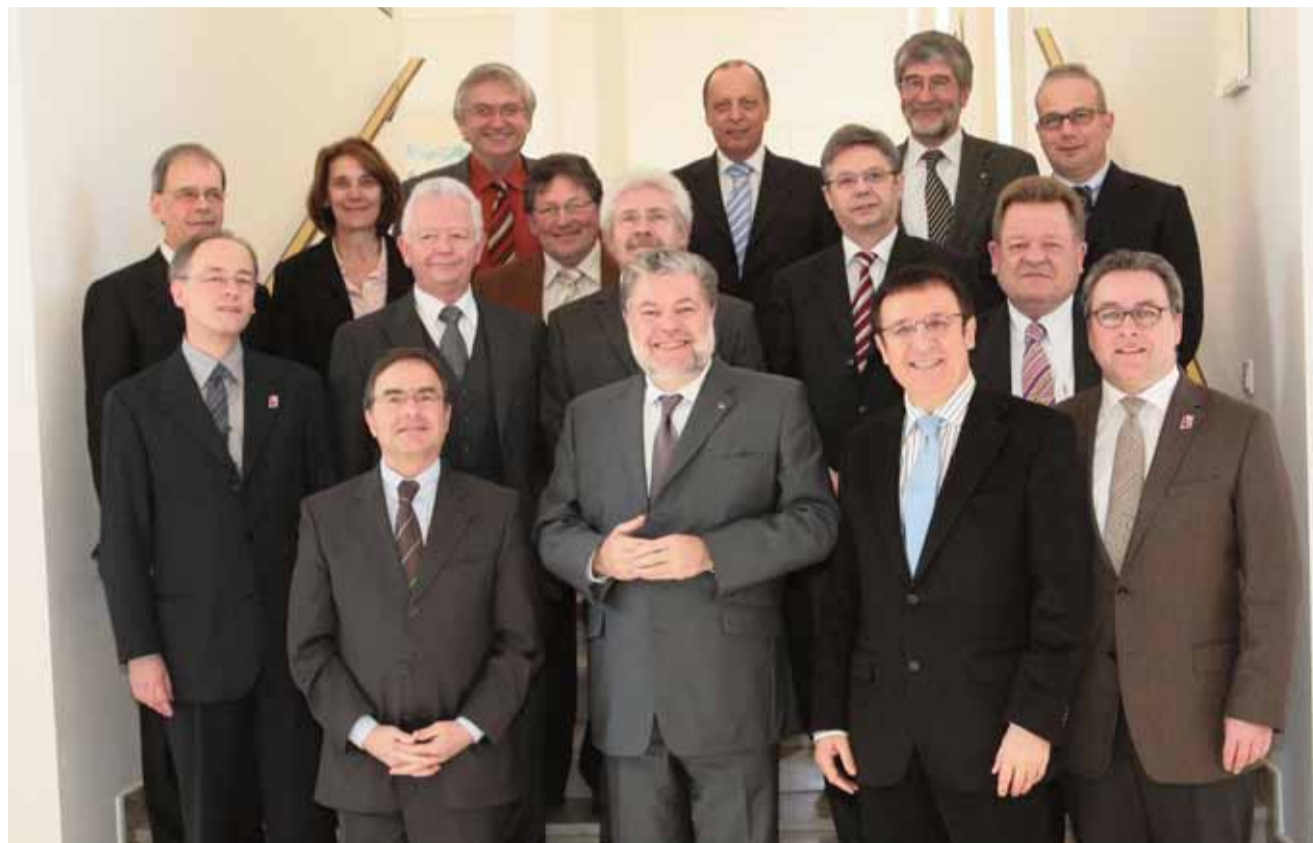
Um die Weiterentwicklung der Metropolregion Oberrhein ging es bei einem Kamingsgespräch, zu dem Ministerpräsident Kurt Beck Vertreter aus Politik, Wirtschaft und Wissenschaft in die Staatskanzlei eingeladen hatte.

Ausgabe A Postvertriebsstück · Entgelt bezahlt · G 6436 Oppenheimer Druckhaus GmbH 55232 Alzey